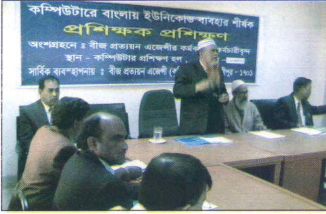
কম্পিউটারে ইউনিকোড ব্যবহার শীর্ষক প্রশিক্ষণ কোর্সের উদ্বোধনী অনুষ্ঠান