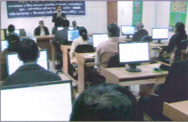
বীজ প্রত্যয়ন এজেসী এর কম্পিউটার ল্যাবে কম্পিউটার প্রশিক্ষণকালীন খন্ডচিত্র