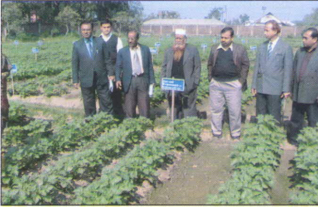
আলুর গ্রো-আউট টেস্ট পর্যবেক্ষণ