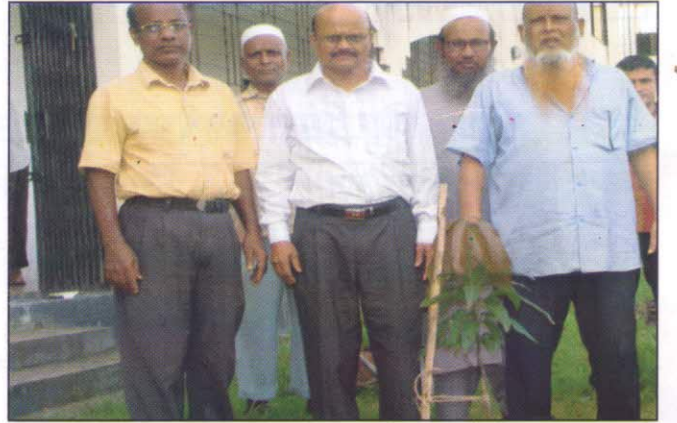
বীজ প্রত্যয়ন এজেসী, গাজীপুর ক্যাম্পাসে বৃক্ষ রোপন অভিযান