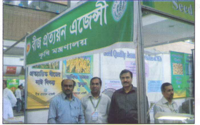
সার্ক বীজ মেলায় অংশগ্রহণকারী বীজ প্রত্যয়ন এজেসীর স্টল